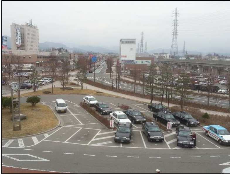
J R 佐久平駅周辺