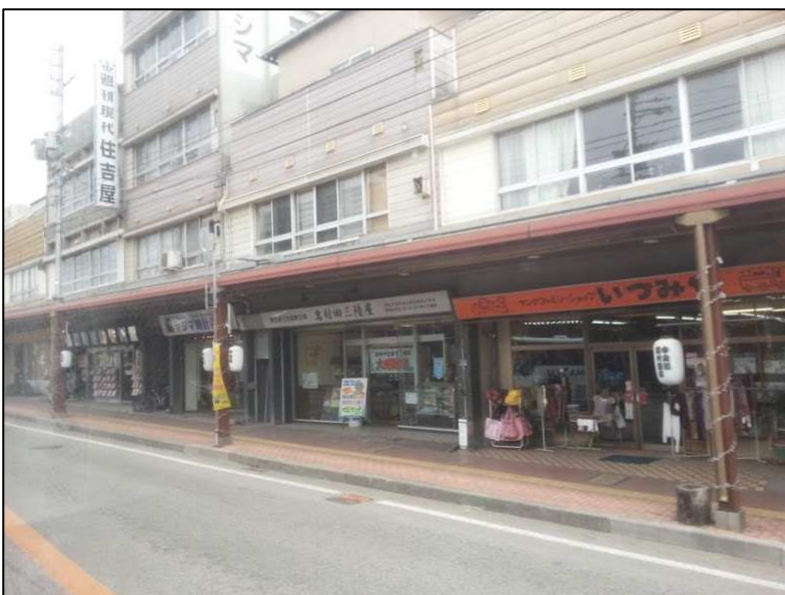
佐久市旧市街地 (岩村田宿)