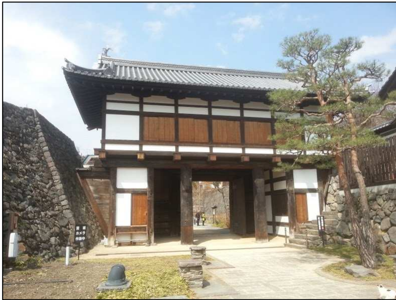
小諸市のまちなみ (懐古園)