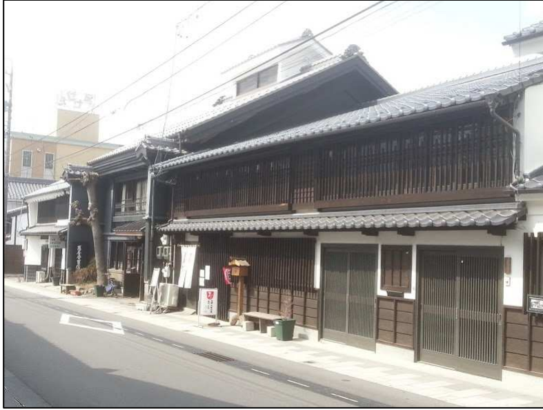
小諸市のまちなみ