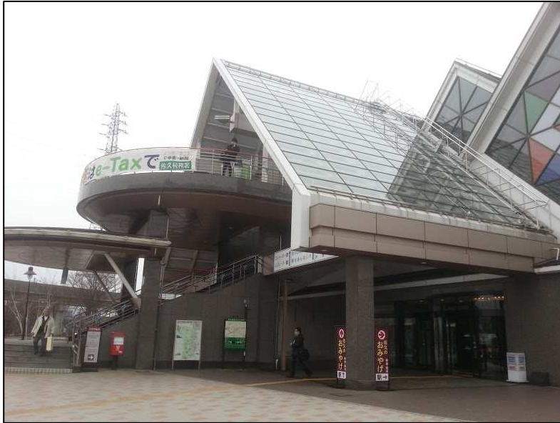
J R 佐久平駅