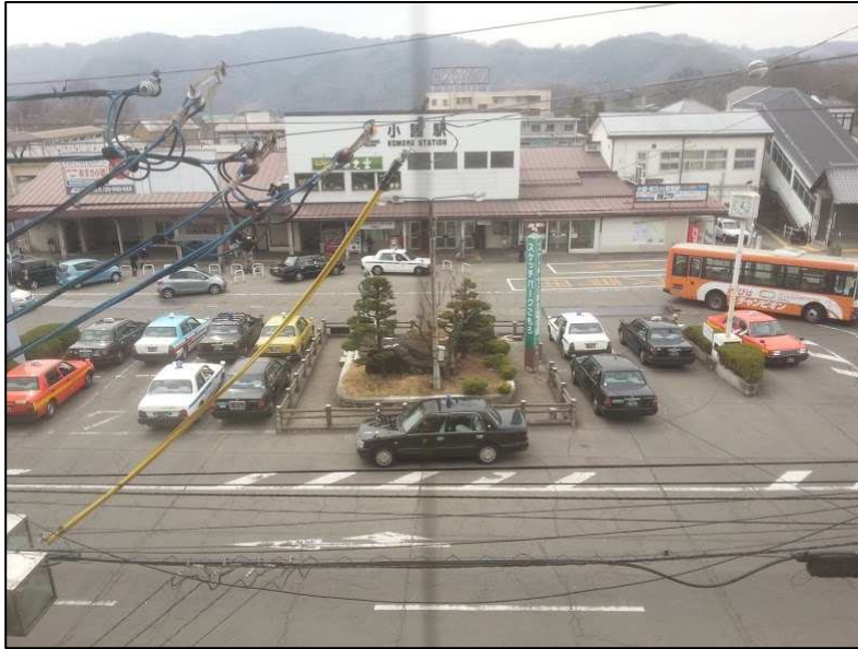
小諸駅 〔 JR小海線 しなの鉄道 〕