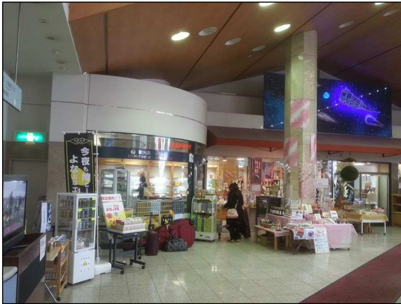
J R 佐久平駅構内 (おみやげ売り場)