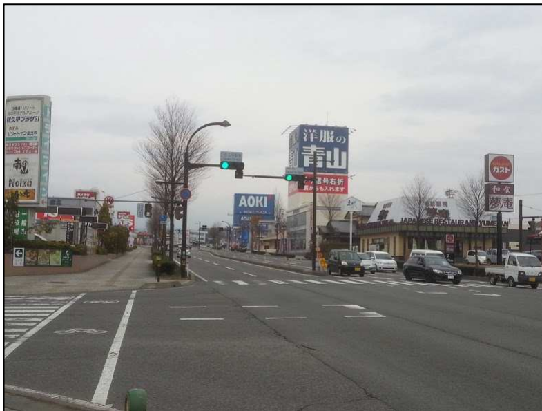
J R 佐久平駅周辺