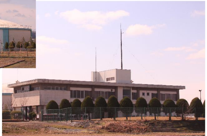
鯖江市上水道管理センター