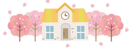
より良いこども園を

答 全体で11億円前後を見込んでいる。より良いこども園とするため、議会や、神明保育所および神明幼稚園の保護者、地域の方などに対して、丁寧に説明しながら進めていきたい。