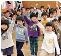
ワクワク子育て 日本一を目指して

答 配置基準を満たす保育士の人数は、確保しているが、預かる児童の低年齢化、気がかりな児童の増加などに対応するため、配置基準以上の保育士や支援員について、現在、募集をしているところである。